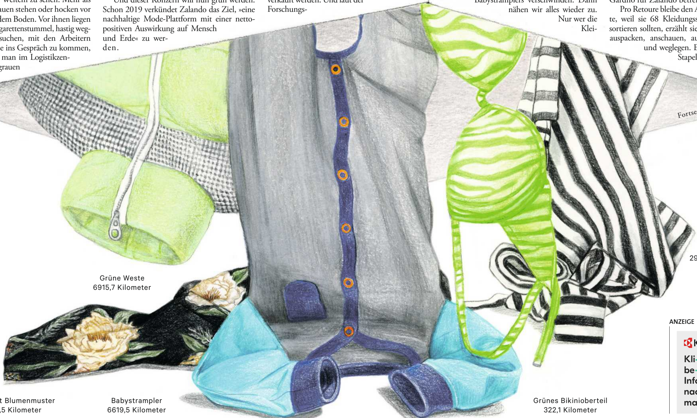
Grüne Weste 6915,7 Kilometer