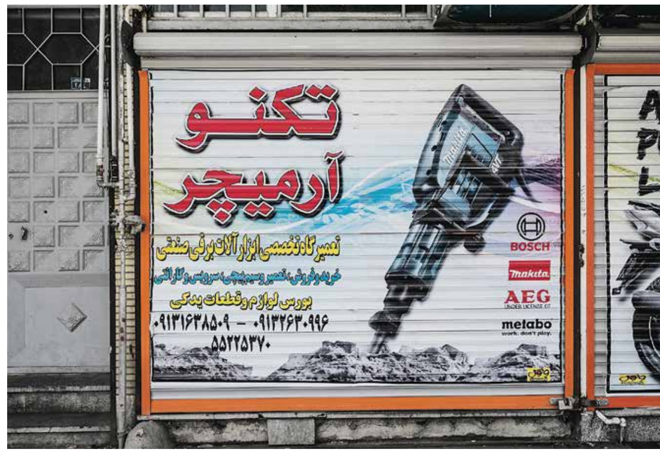
Deutsche Firmen werben 2015 in Teheran, seit 2018 ist das Exportgeschäft eingebrochen.