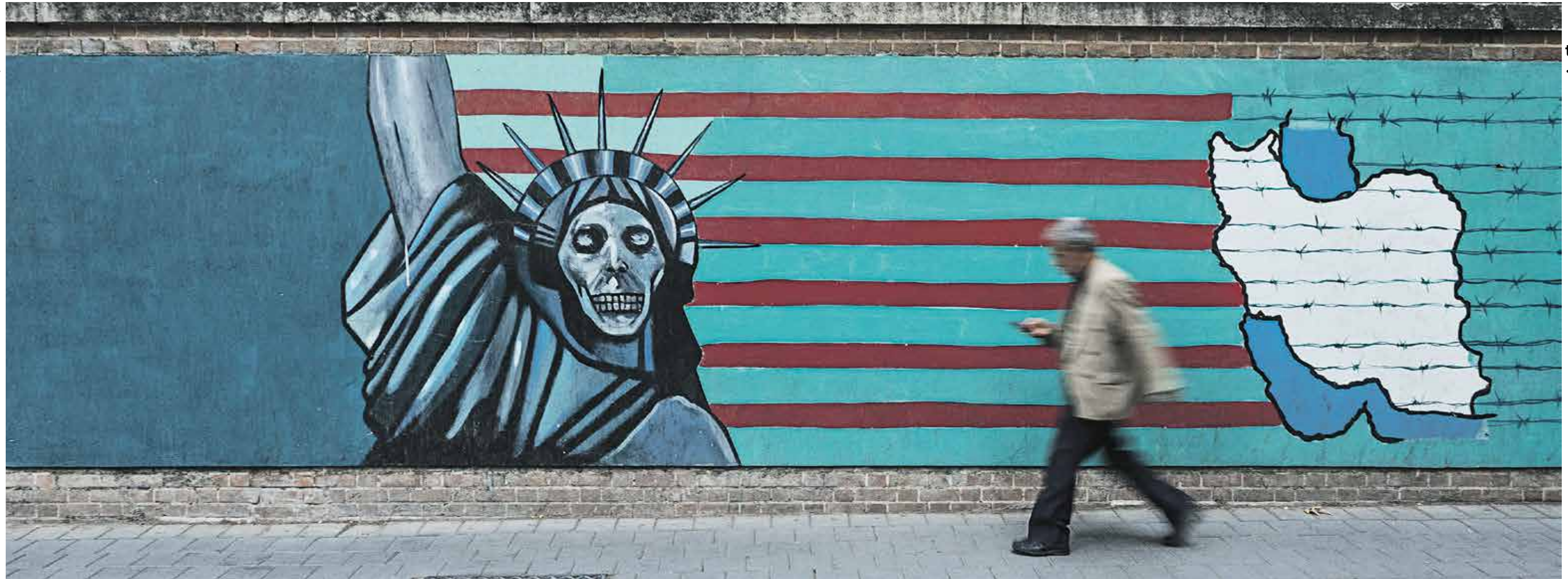
Hass auf die USA gibt es in Iran nicht erst seit Trumps Präsidentschaft, wie dieses Wandbild an der ehemaligen US-Botschaft in Teheran zeigt.